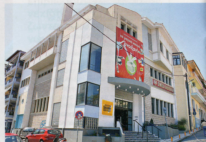
Το κτίριο της Βιβλιοθήκης.