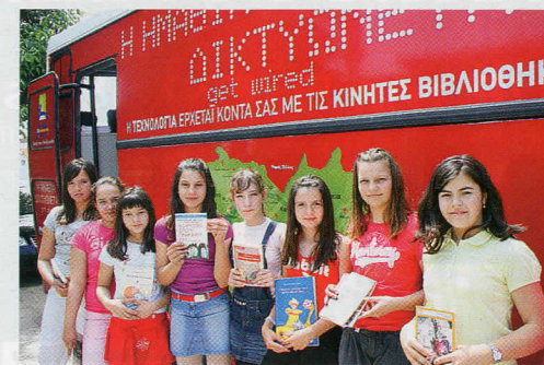
Από το πρόγραμμα των Κινητών Βιβλιοθηκών.