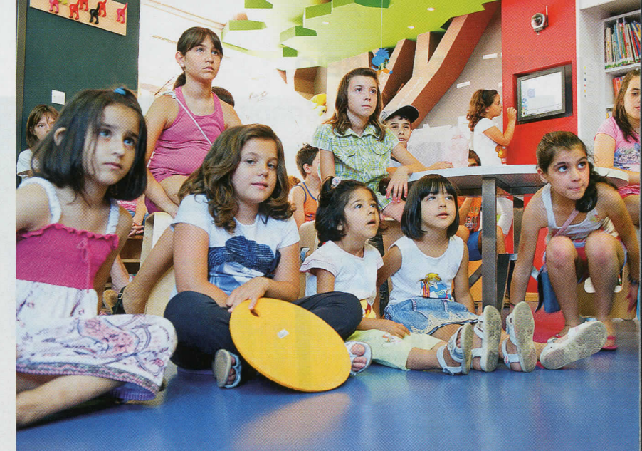
Το παιδικό τμήμα της Βιβλιοθήκης

Η περίπτωση της Βέροιας ξεχώρισε ανάμεσα σε 300 υποψηφιότητες απ' όλο τον κόσμο και κέρδισε μια θέση στη λίστα με τις πέντε επικρατέστερες. Στη συνέχεια το Ίδρυμα προχώρησε σε επίσημα έρευνα σε καθεμιά από αυτές, αποστέλλοντας ινκόγκνιτο κάποιον εμπειρογνώμόνα του. «Εμείς δε μάθαμε ποτέ, αν ήρθε κάποιος εδώ στη Βέροια» επισημαίνει ο διευθυντής της Βιβλιοθήκης. Αυτό που εμείς μάθαμε είναι ότι με το σύνολο των δραστηριοτήτων της και με την «κορωνίδα» αυτών, «Τα Μαγικά Κουτιά», η Δημόσια Βιβλιοθήκη της Βέροιας κατάφερε να συγκεντρώσει την υψηλότερη βαθμολογία και να έρθει πρώτη στην τελική κατάταξη.